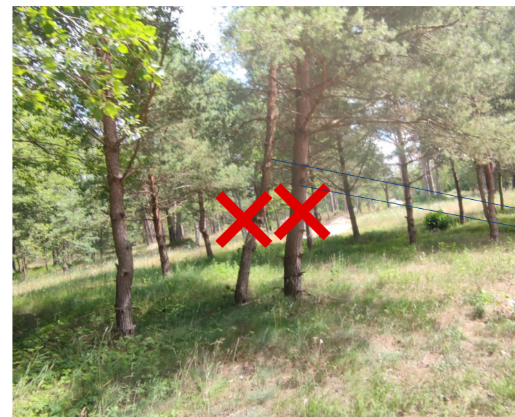
FOTOFIKSĀCIJA Skats uz nocērtamo koku Nr.11 un Nr.12