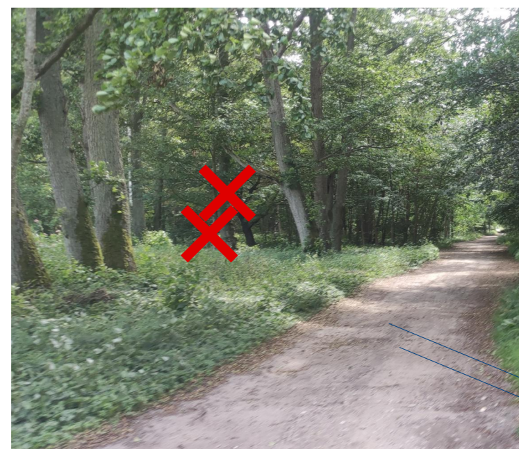
FOTOFIKSĀCIJA Skats uz nocērtamo koku Nr.1 un Nr.2