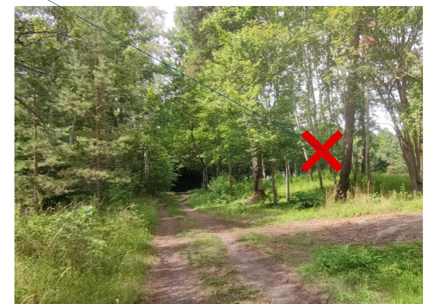
FOTOFIKSĀCIJA Skats uz nocērtamo koku Nr.7