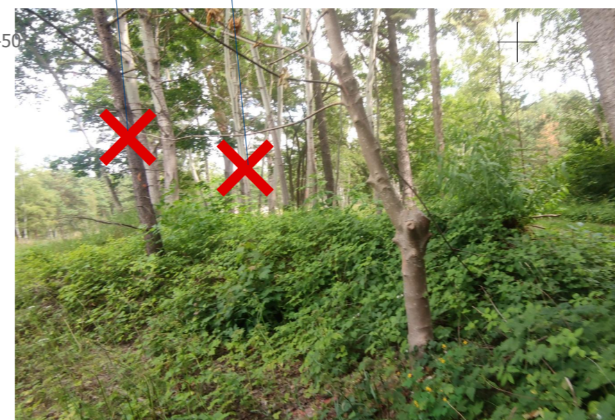
FOTOFIKSĀCIJA Skats uz nocērtamo koku Nr.4 un Nr.6