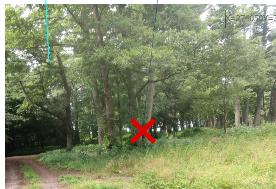
FOTOFIKSĀCIJA Skats uz nocērtamo koku Nr.3