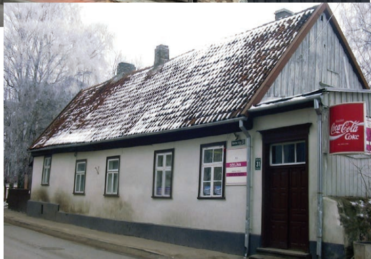
ПРОГРАММА ПО СОХРАНЕНИЮ ПАМЯТНИКОВ КУЛЬТУРЫ В ЛИЕПАЕ 2015 – 2021 ГГ.

В 2015 году при проведении архитектурно-художественного исследования в подвале дома была найдена створка филленчатых наружных дверей, по ее образцу отреставрированы все филленчатые створки, выполненные из сосны. Отреставрированы и сохранившиеся элементы дверного портала: фрамуга, средник, дверные коробки, притворные планки, профилированный карниз, козырек, порог. Где это было возможно, сохранены оригинальные детали или же по образцу изготовлены новые, применялась и современная фурнитура: петли, механизмы