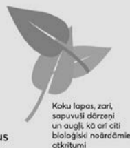
Koku lapas, zari, sapuvuši dārzeņi un augļi, kā arī citi bioloģiski noārdāmie atkritumi