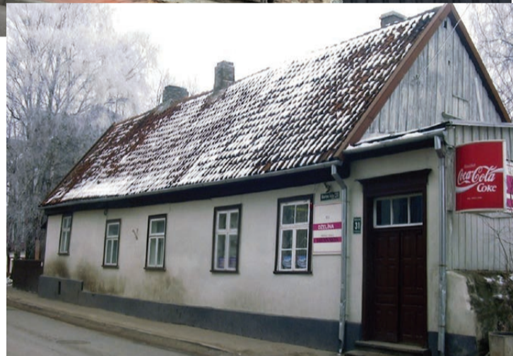
KULTŪRAS PIEMINEKĻU SAGLABĀŠANA LIEPĀJĀ 2015.–2021. GADĀ