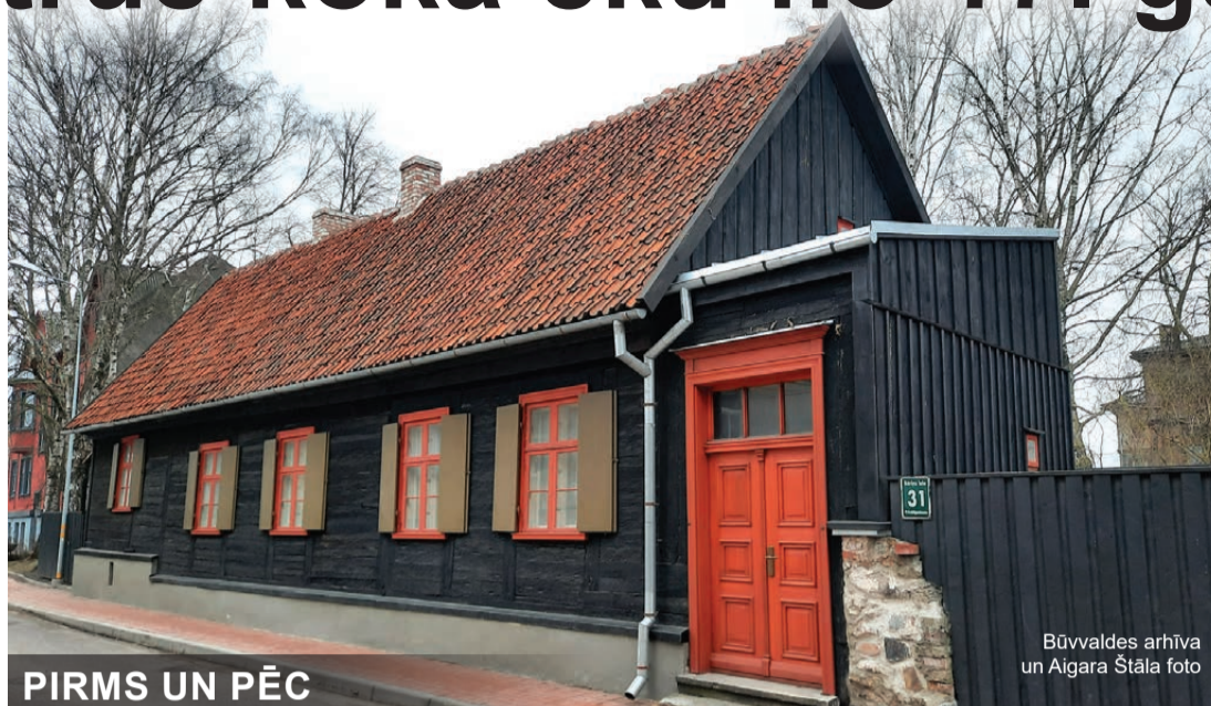
PIRMS UN PĒC RESTAURĀCIJAS

Būvdarbu pirmajā kārtā tika pabeigta ēkas vēsturisko ārdurvju