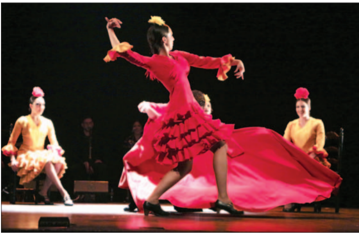
Sērijā "Pasaule Lielajā dzintarā" notiks krāšņs flamenko uzvedums, kurā saviesies mūzika, dejas un skatuves māksla.