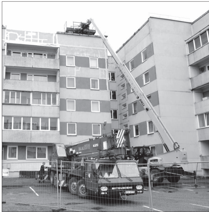
Aisteres ielas 7 nama jumts draudēja iebrikt un pēc tam, kad tas tika salabots, Liepājā apsekoja arī citu namu jumtus, lai novērstu iespējamās traģēdijas.

Ir apsekojamas 244 dzīvojamās ēkas ar plakanajiem jumtiem, par ko liecina saņemtie akti vai citi dokumenti. Galvenokārt ir veikta ēku apskate un fotofik-