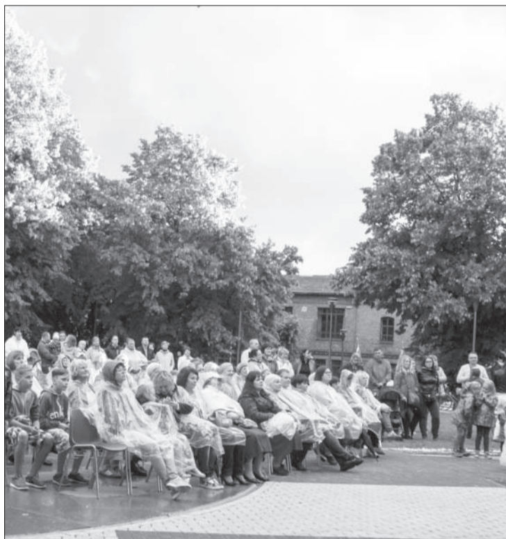
Jāņa Čakstes laukumā rīkoti vasaras koncerti ir vēl viena jauna Liepājas tradīcija. Gan liepānieki, gan pilsētas viesi labprāt apmeklē augstas kvalitātes mākslinieku priekšnesumus brīvā dabā.

Plašāka informācija interneta mājaslapā www.rallykurzeme.lv un "Rally Liepāja" interneta mājaslapā www.lvrally.com . ■■■