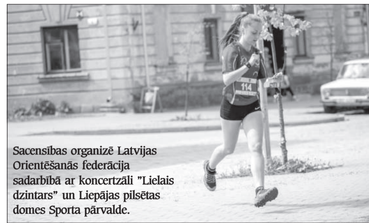
Sacensības organizē Latvijas Orientēšanās federācija sadarbībā ar koncertzāli "Lielais dzintars" un Liepājas pilsētas domes Sporta pārvaldi.

"DR-Krasts" seriāla kārtā pie Liepājas A. Puškina 2. vidusskolas 2. maijā sāksies plkst. 16, bet doties "Lielā dzintara" labirintos 5. maijā varēs sev ērtā laikā no plkst. 16.00 līdz 18.30. Savukārt ar Latvijas čempionāta orientēšanās sportā noteikumiem aicinām iepazīties sacensību mājaslapā: http://lc.lof.lv/2017/sprints/ ■