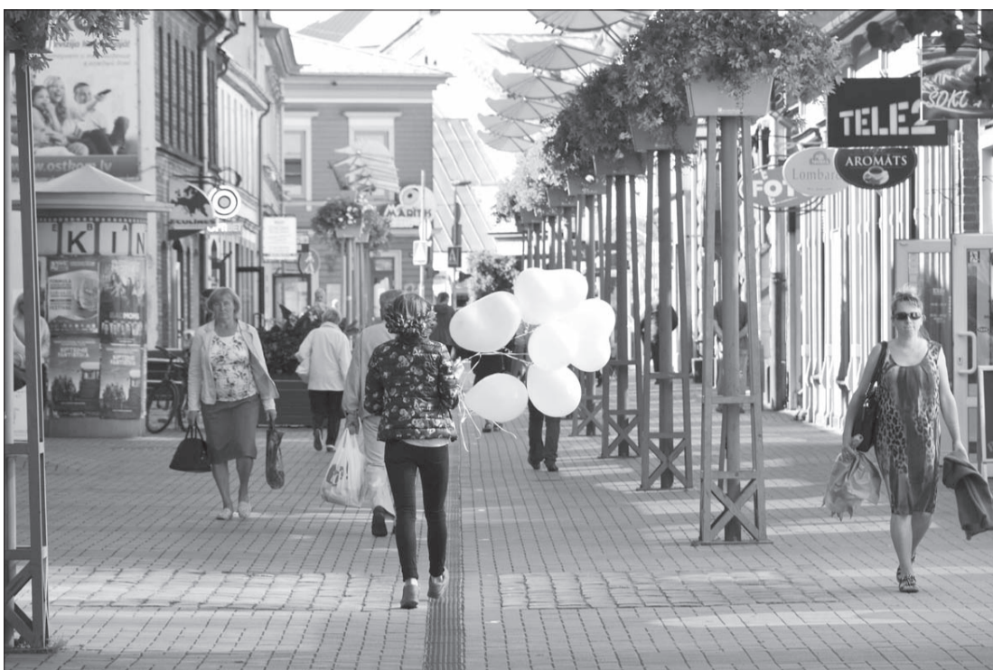
Liepājas pilsētas apstādījumu koncepcijā 2016.–2019. gadam iekļauti priekšlikumi pilsētas apstādījumu papildināšanai un paredzamās aptuvenās izmaksas, kā arī jauno koku stādījumu un esošo koku vainagu kopšanas plāns. Esošie apstādījumi un puķu dobes pilsētā tiek saglabātas un koptas, taču daudzviet apstādījumus plānots pilnveidot, bet vēl citur veidot no jauna.

Jaunu puķu dobi un dekoratīvos stādījumus šopavasara iekops pie O. Kalpaka tilta. Šeit 150 kvadrātmetru platībā Karostas pusē izpletīsies "puķu upe" ar ziemcietēm un dažādām sīpolpuķēm.