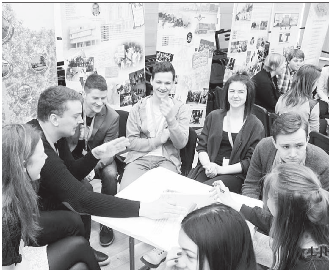
Darba moments no "Jauniešu galvaspilsētas" atklāšanas pasākuma, kur uz Strukturēto dialogu bija pulcējušies jaunieši no visas Latvijas.

Liepājas Bērnu un jaunatnes centra struktūrvienības