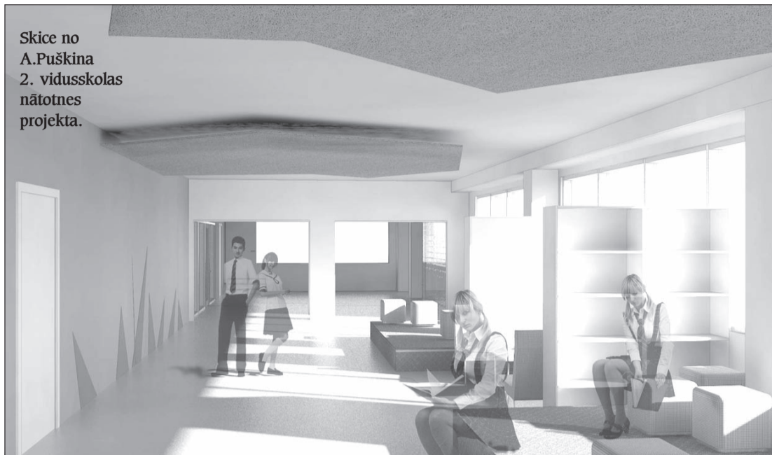
Skice no A. Puškina 2. vidusskolas nākotnes projekta.

Liels ieguvums pilsētai būs Raiņa 6. vidusskolas jaunais sporta laukums, kuru varēs izmantot arī izglītojamie no