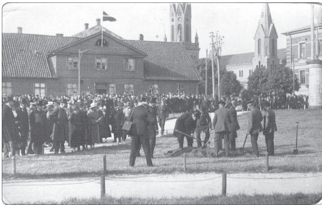
1925. gadā, Liepājas 300. jubilejā, Latvijas valsts pirmais prezidents Jānis Čakste viņa vārdā nodēvētajā laukumā katrā tā stūrī iestādīja pa liepai.

Liepājas simtgades ozolu stādīšanu ar savu klātbūtni pagodinās un klātesošos uzrunās arī NBS komandieris ģenerāl-