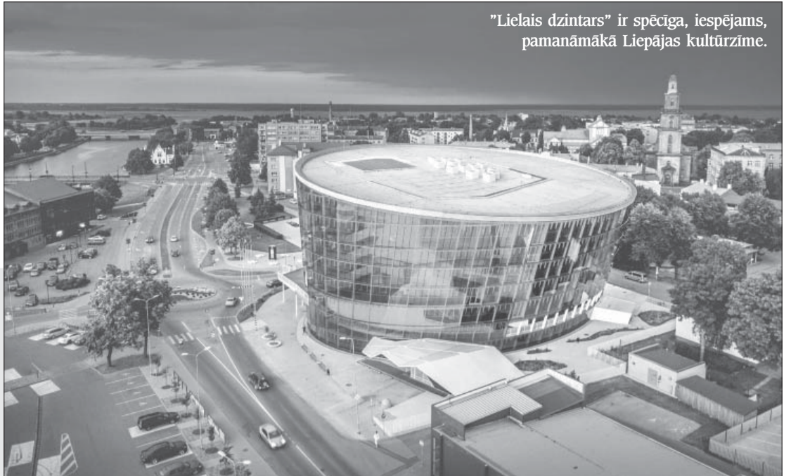
"Liels dzintars" ir spēcīga, iespējams, pamanāmākā Liepājas kultūrzīme.

"Liels dzintars" oranžie stikli rietošās saules staros iemirdzas kā zelts. Zāli pamazām piepilda klausītāji, trīsu klusas skaņas – orķestra mūzikas instrumentu iedziedāšanās koncertam. Svinīgais mirklis, kad klausītāji saspringst gaidās un diriģents sveicina pirmo vijoli, var sākties. Pateicoties vairākiem desmitiem SIA "Liels dzintars" darbinieku, kuri rosās stiklotajā ēkā jau kopš saules lēkta.