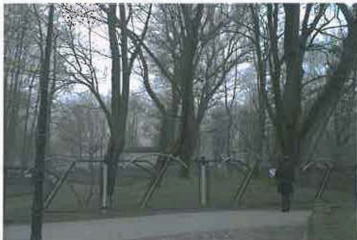
3.attēls. Esošo kokaugu grupas. Iekļaujot dižkoku – papele.

Kopumā teritorija ir noēnotā dēļ lielā lapu koku skaita, kas neļauj veidoties pilnvērtīgs zemsedzei vai plānot krāšņus apstādījumus dārza teritorijā (3.attēls).