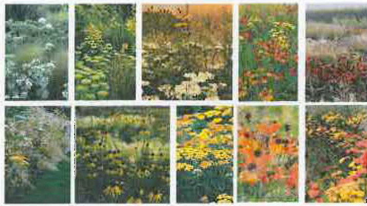
6.attēls. Dzintara toņi apstādījumos

Esošais noēnojums apdraud teritorijas pilnvērtīgu attīstību, tāpēc plānots pēc arboristu ieteikuma likvidēt mazvērtīgos kokus ainavas kopšanas nolūkos, kas ļaus nodrošināt teritorijas izsauļojumu. Esošais labiekārtojums – atbalsta sienas, pakāpieni, nožogojums neveicina mūsdienīgo teritorijas attīstību, pēc plānošanas uzdevumā un balstoties uz izstrādātam vadlīnijām plānots to likvidēt, kas pamato arī atsevišķo kokaugu likvidēšanu – papeles un kļavas, kas atrodas tuvu atbalsta sienām. Daļa no esošiem kokaugiem likvidējami arī pašas estrādes pārbūves dēļ.