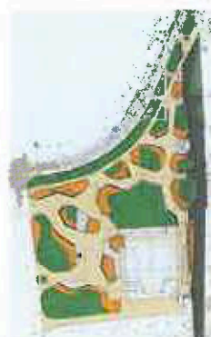
Dzintara foama/ Dzintara toņi Pulcēšanas/ Plāsmas