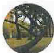
Festivāls «Liepājas Dzintars» Liepājas jūrmalas parks