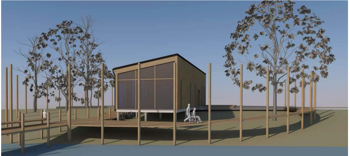
Plānotās "Dabas mājas" vizualizācija