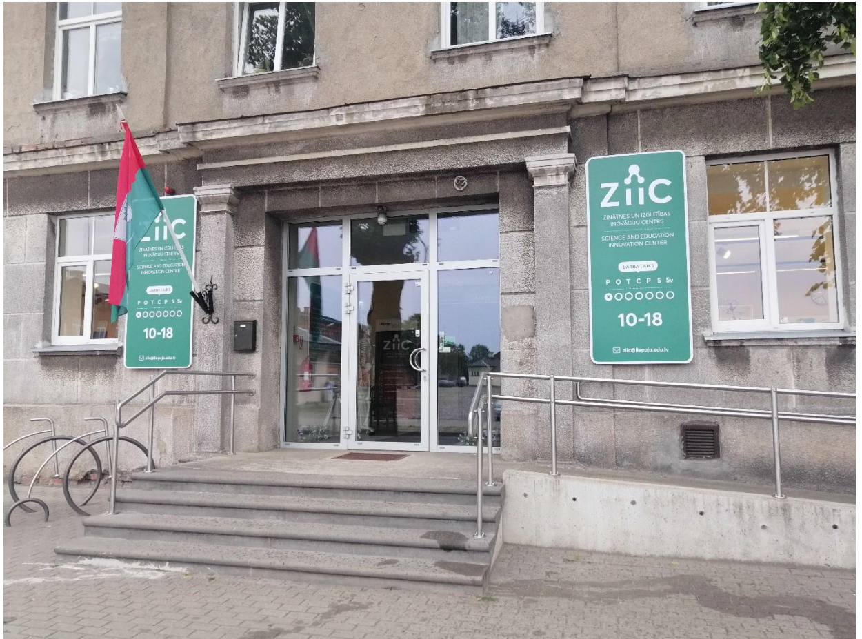
Pastāvošais "Zinātnes un izglītības inovāciju centrs" (ZIIC), kur plānota darbnīcas "Makerspace" atrašanās vieta