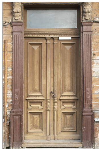
Kuršu laukums 15.