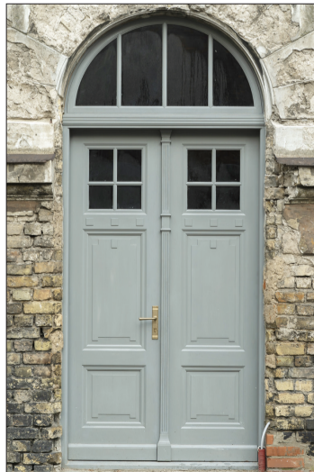
Šaurā iela 2.