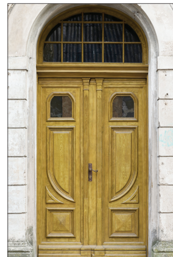
Bāriņu iela 21.