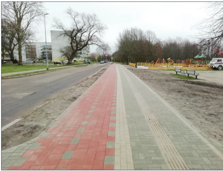
Atjaunotā ietve un basketbola laukuma apkārtnes labiekārtojums Dunikas ielā.