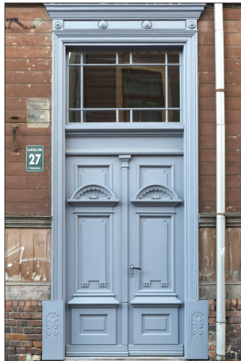
Ludviķa iela 27.