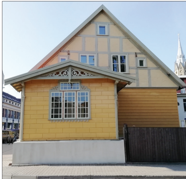
Restaurētās verandas Liepājā.

Jāpiebilst, ka Kuršu ielā 2 ar ēkas ārdurvju un verandas pie-