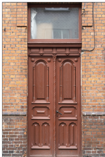
Elkoņu iela 6.

Dokumentācijas sagatavošanai līdzfinansējums ir 75 procenti no kopējām izmaksām, bet ne vairāk kā 2000 eiro, restaurācijas būvdarbiem – 75 procenti no kopējām izmaksām, bet ne vairāk kā 20 000 eiro. Savukārt atsevišķu detaļu, piemēram, vēsturisko logu, durvju u.c. elementu, atjaunošanai – 50 procenti no kopējām izmaksām, bet ne vairāk kā 2000 eiro. ■