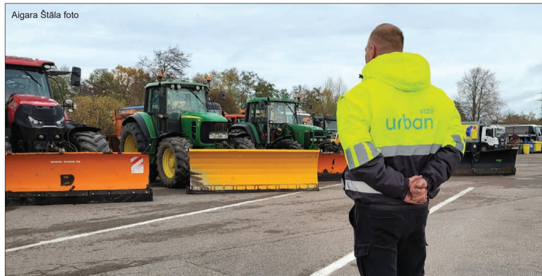
Ziemas tehnika gatava darbam. Uzņēmuma SIA "Vizii Urban" bāzē Cukura ielā ir nodrošināts nepieciešamais tehnikas vienību skaits un veidi, darbā pieņemti šoferi un cits personāls, sagādātas smilts un sāls maisījuma un tehniskā sāls rezerves.

No 1. novembra darbu ir sācis Komunālās pārvaldes Ziemas dienests – tas nozīmē, ka visu diennakti pilsētas ielās notiek braukšanas apstākļu izvērtēšana un nepieciešamības gadījumā uzsākta pretslīdes materiāla kaisīšana vai brauktuviņu tīrīšana no sniega. Pirmo reizi šajā sezonā ziemas tehnika pilsētā strādāja 20. novembra naktī.