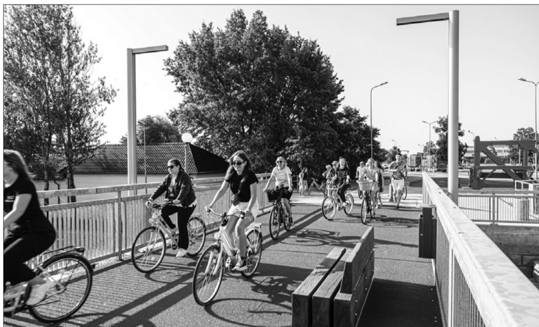
Pārbūvētā dzelzceļa tilta atklāšana šovasar, blakus novietots tilta vēsturiskais fragments.

• akceptēta 831 projekta dokumentācija (pērn par visu gadu kopā – 1022), no kā 224 bijuši