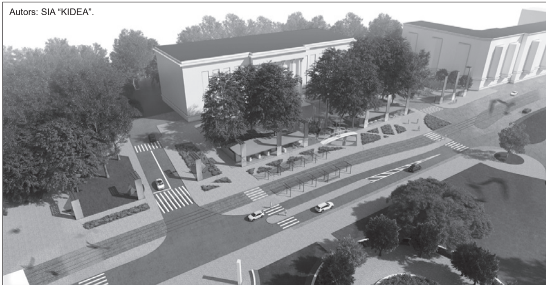
LiepU skvēra labiekārtojuma idejas no metu konkursa uzvarētāju darba ar devīzi "12 brāļi".

līnijas projekta apjomu, taču ir tieši saistīta, un to paredzēts risināt atsevišķā būvprojektā, ar citu finansējuma avotu.