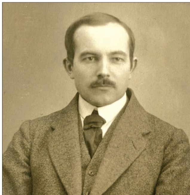
Mākslinieks Jānis Sudmalis (1887–1984)

Ideja par Liepājas muzeja izveidi meklējama vairākus gadus pirms muzeja dibināšanas – vēl Latvijas Neatkarības kara (1918–1920) laikā, kad mākslinieks Jānis Sudmalis (1887–1984), saņēmdams Latvijas Pagaidu valdības atļauju, apbraukāja Kurzemi un vāca latviešu etnogrāfiskos priekšmetus.