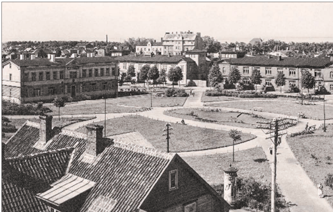
Muzejs Alejas (mūsdienās Jāņa Čakstes) laukumā, 20. gs. 20. gadi.