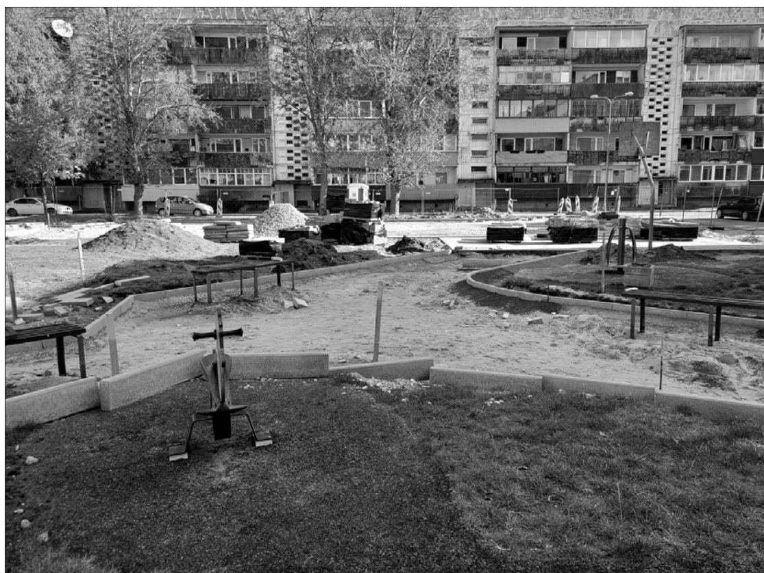
Pēc būvdarbiem Vērgales ielā 3, iekšpagalmā, būs uzlabots šeit esošā rotaļu un sporta laukuma plānojums, pieejamība un izskats.