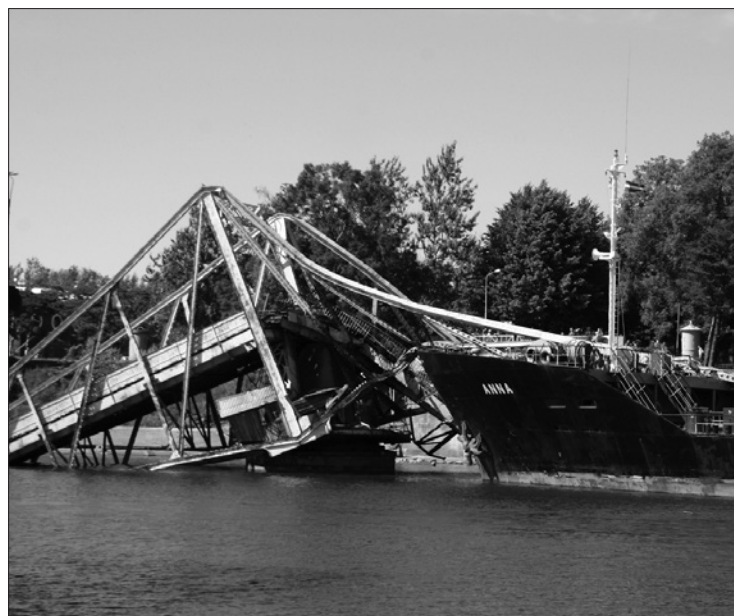
O. Kalpaka tilts pēc negadījuma 2006. gada jūlijā, kad tankkuģis “Anna” ieskrēja tilta ziemeļu daļā, tika neatgriezeniski bojāts, un bija nepieciešami četri gadi, lai Karostu atkal savienotu ar pārējo pilsētu.