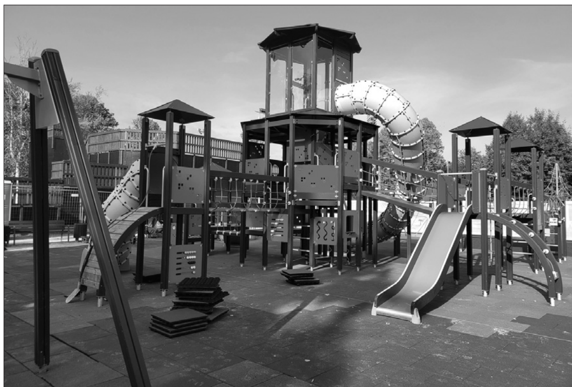
Jaunais bērnu rotaļu laukuma aprīkojums ar nosaukumu "Bāka", kas iekļaujas un papildina Jūrmalas parkā esošo rotaļu laukumu, kopš oktobra ir pieejams apmeklētājiem.

Līdz ar jaunā sporta laukuma izbūvi bojātais celiņu un basketbola laukuma segums un cits nederīgais aprīkojums ir demontēts, bet vietā būs jaunas bruģēšanas takas, uzstādīti jauni soliņi, atkritumu tvertnes, pārvietota vingrošanas iekārta – kopumā uzlabots gan rotaļu, gan vingrošanas, gan sporta laukuma plānojums, pieejamība, labiekārtojums un izskats. ■