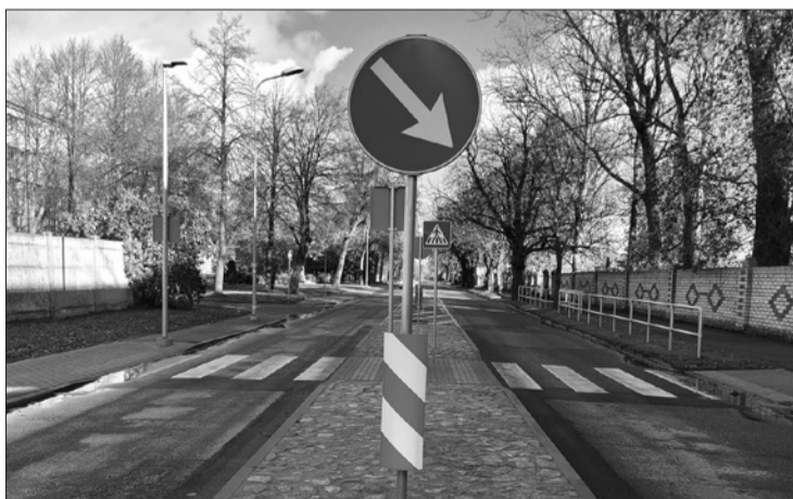
Безопасно и наглядно. На улице Флотес (возле социального дома, приюта и бизнес-парка) создали новый пешеходный переход с освещением.