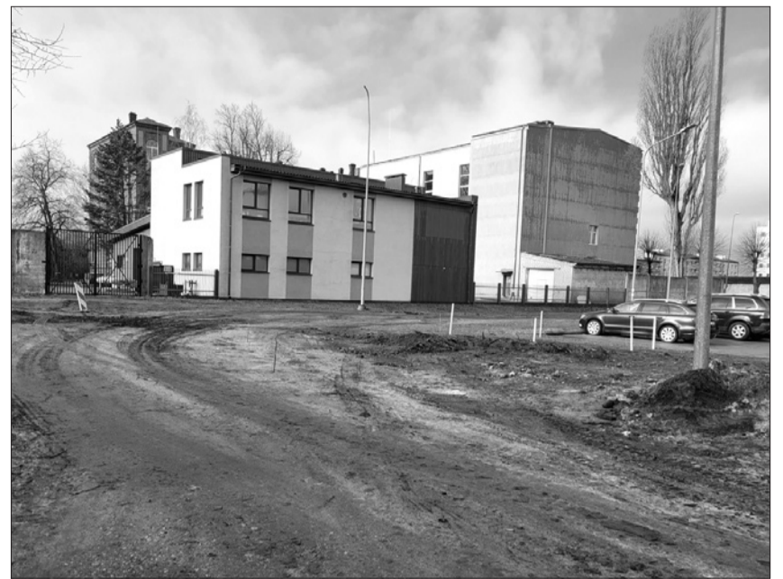
Muitas ielas posms – pirms un pēc pārbūves. Tagad Mui- tas ielā ir ērtāka un drošāka pārvietošanās gan gājējiem, gan autovadītājiem.

Komunālā pārvalde atbilstoši deputātu apstiprinātajam šā gada investīciju budžetam nodrošina vairāku ielu infrastruktūras būvprojektu īstenošanu. Daļa no tiem ir pabeigti un nodoti ekspluatācijā.