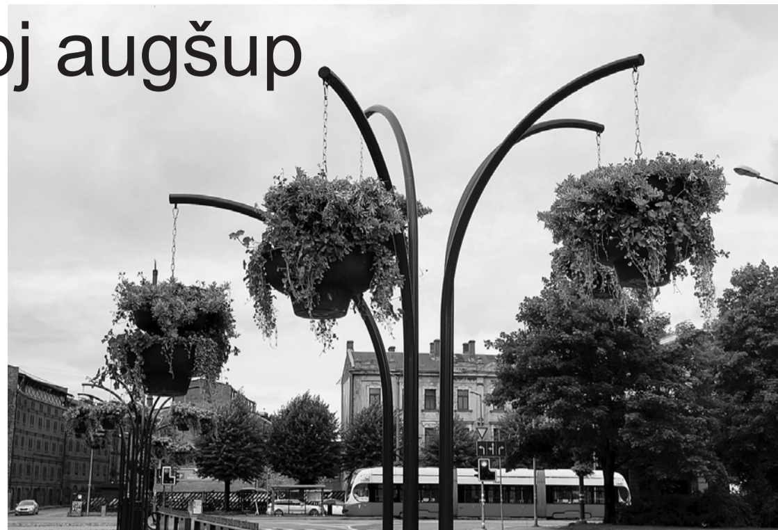
Komunālā pārvalde šovasar turpinājusi Liepājas pilsētas apstādījumu koncepcijas 2020.–2024. gadam uzdevumu izpildi – Jaunajā ostmalā, uz satiksmi sadalošās joslas, ir uzstādīti trīs vides objekti – puķu koki.

Nākamajā gadā saskaņā ar minēto dokumentu Jūrmalas parkā gar veloceļu, aptuveni 700 m garā posmā no koncertestrādes "Pūt, vējiņi!" izejas uz pludmali līdz rezerves stadionam, ir plānots sakopt esošo krūmu stādījumus – nomainīt vai likvidēt nove-