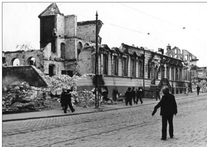
Ущерб, нанесенный Лиепе во время Второй мировой войны.