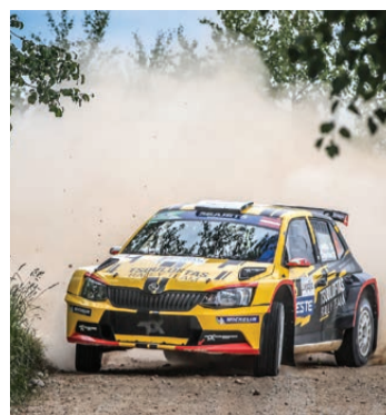
Pasaules čempionāts rallijā