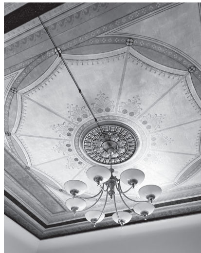
Автор: Агрис Паделис-Линс. Ответственный руководитель строительства: Гинт Эрнстсонс. Подрядчик: ООО Hermes invest. Заказчик: ООО Hermes invest.

В дачной застройке в квартале вокруг Лебединого пруда восстановлено еще одно историческое здание по ул. Пелду, 56, которое перестроено в гостиницу. Гостиница ROZE Peldu Residence дополнит места размещения в Лиепае 12 уютными апартаментами.