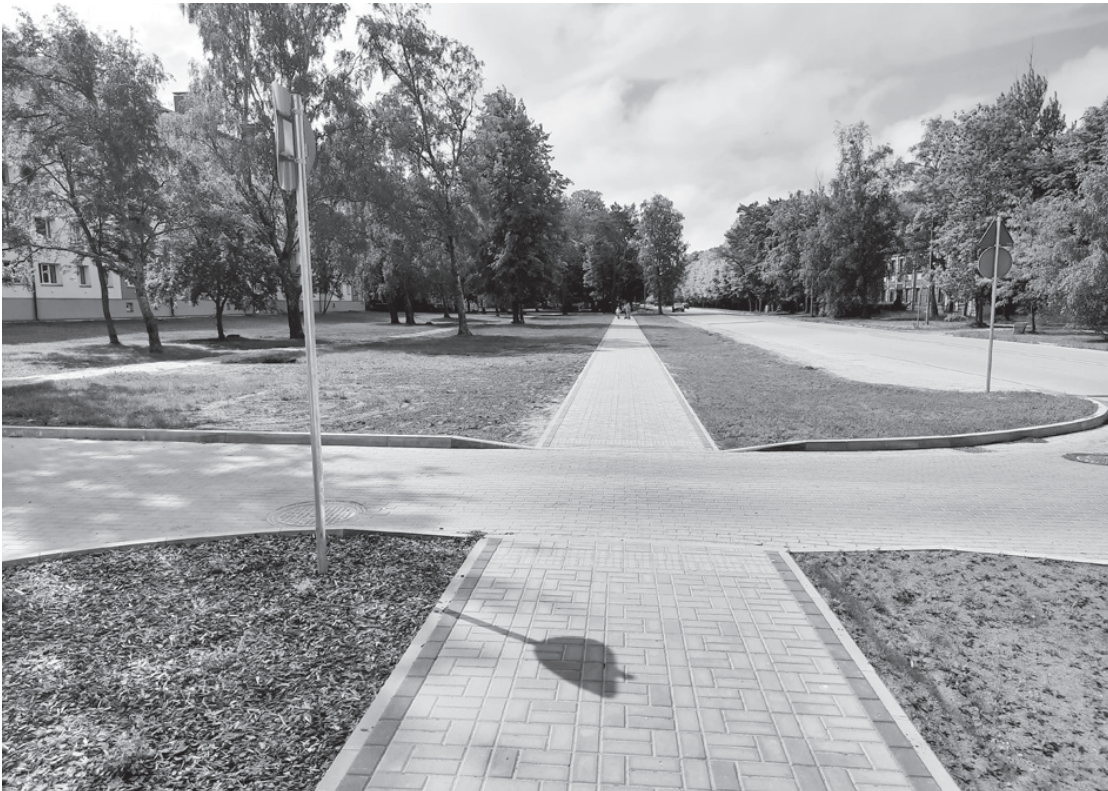
Atmodas bulvārī no Katedrāles ielas līdz pagriezienam uz Ziemeļu molu ir izbūvētas jaunas autostāvvietas pie šeit esošajiem veikaljiem, gājēju pāreja ar nepieciešamajām ceļu satiksmes drošības zīmēm, sabiedriskā transporta pieturvieta un ierīkoti apstādījumi.