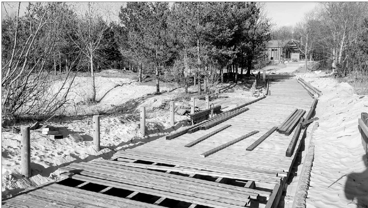
Jārēķinās ar neērtībām. Pēc peldsezonas sākuma vēl kādas nedēļas turpināsies trīs pludmales izeju izbūve un labiekārtošana – pie Centrālās glābšanas stacijas, kā arī pie kafejnīcām “Red Sun Buffet” un “7. līnija”.

No peldsezonas sākuma atsācis strādāt Pludmales glābša-