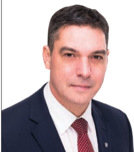
Gunārs Anšņs, Liepājas valstspilsētas pašvaldības domes priekšsēdētājs

4. maijā Latvijas Republikas Neatkarības atjaunošanas dienu Liepājā atzīmēsīm ar orientēšanās spēlēm "Liepājas pēdas Latvijā", sportiskā garā izzinot faktus par Liepāju un mūsu pilsētas nozīmi Latvijas vēsturē un kultūrā.