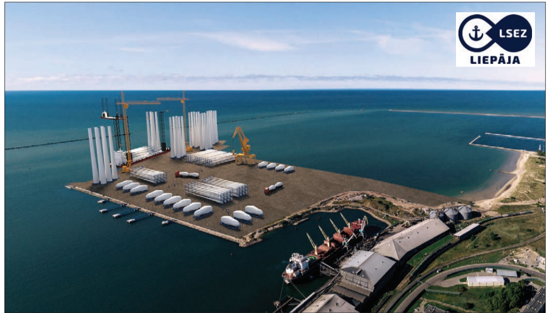
Publicitātes foto un Liepājas SEZ pārvaldes projekta vizualizācijas

Lai Baltijas jūrā izbūvētu atkrastes vēja parkus, nepieciešama atbalsta bāze kādā no ostām. Tieši Liepājas osta ir viena no piemērotākajām vietām šādas infrastruktūras izveidei, ko nosaka arī Liepājas pilsētas un Liepājas SEZ ilgtermiņa attīstības plāni,