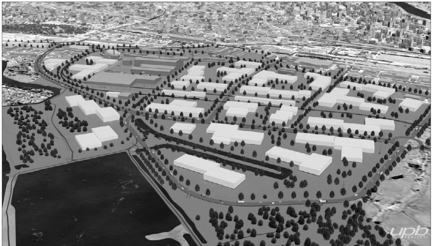
Bijušās “Liepājas metalurga” teritorijas iespējamā attīstība – vizualizācija.

Ir saņemti visu institūciju atzinumi, tajos sniegti gan pozitīvi vērtējumi, kuros institūcijas neiebilst