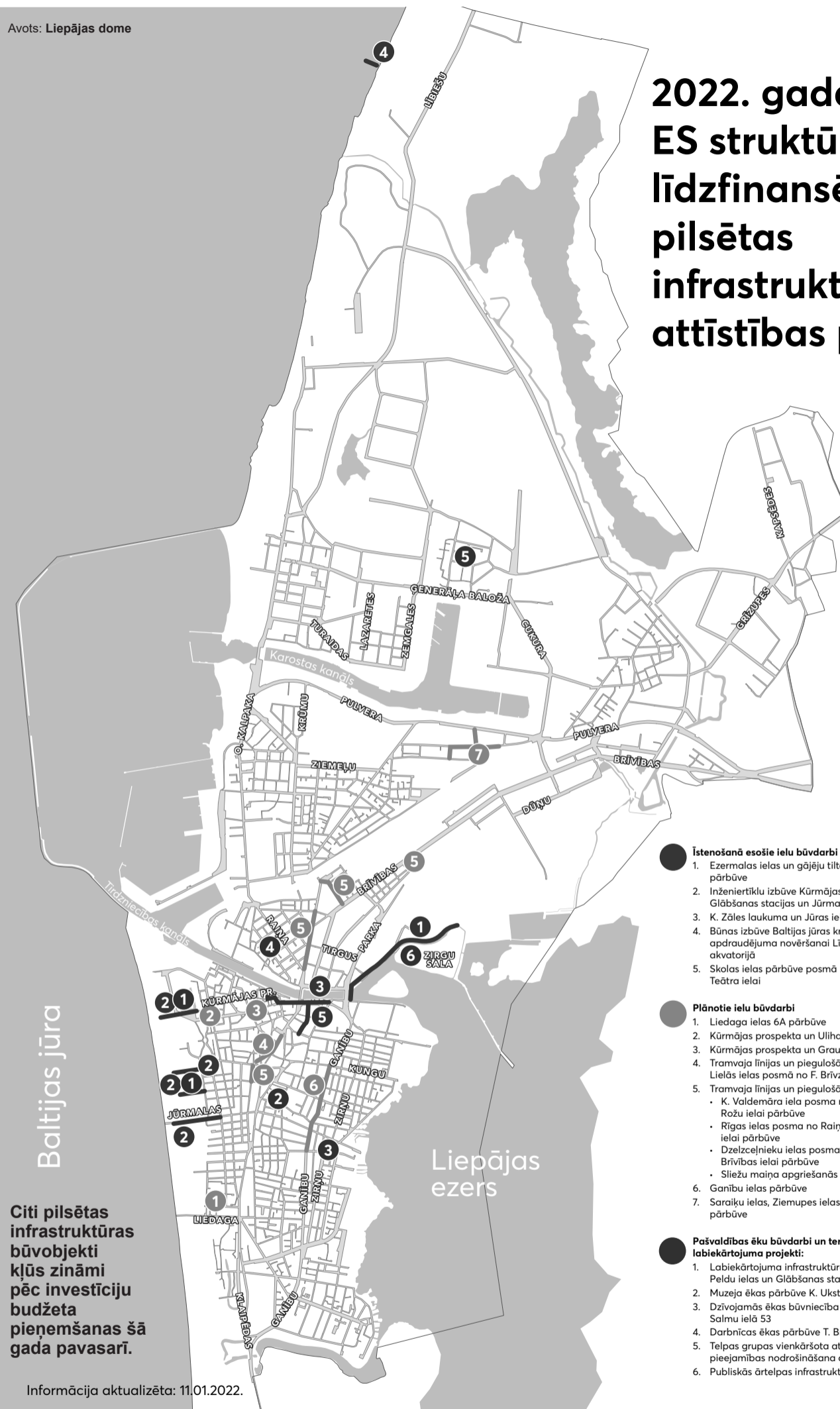
Avots: Liepājas dome

2021. gadā pēc vienkāršotās projektu dokumentācijas (apludinājuma kartēm vai paskaidrojuma rakstiem) notika arī daudzdzīvokļu māju fasāžu un citu ēkas elementu energoefektivitātes uzlabošanas darbi. Šajā segmentā ekspluatācijā ir pieņemti kopumā 17 objekti. Salīdzinājumā ar 2020. gadu, ir par 18 objektiem mazāk, jo 2020. gadā siltināšana notika 35 daudzdzīvokļu mājās. Tas ir saistīts ar to, ka valstī noslēdzās daudzdzīvokļu māju energoefektivitātes uzlabošanas programma iepriekšējā ES struktūrfondu perioda ietvaros.