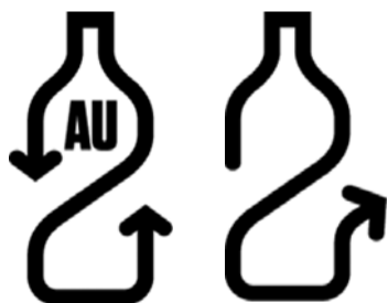
Для повторно наполняемой тары

Важно отметить, что передаваемая депозитная тара должна быть пустой и не должна иметь значительных повреждений. Тара не должна быть сплюсненной, но тароматы примут слегка деформированную или придавленную упаковку. Кроме того, пункты депозита будут принимать тару, приобретенную после 1 февраля 2022 года и имеющую следующую маркировку: