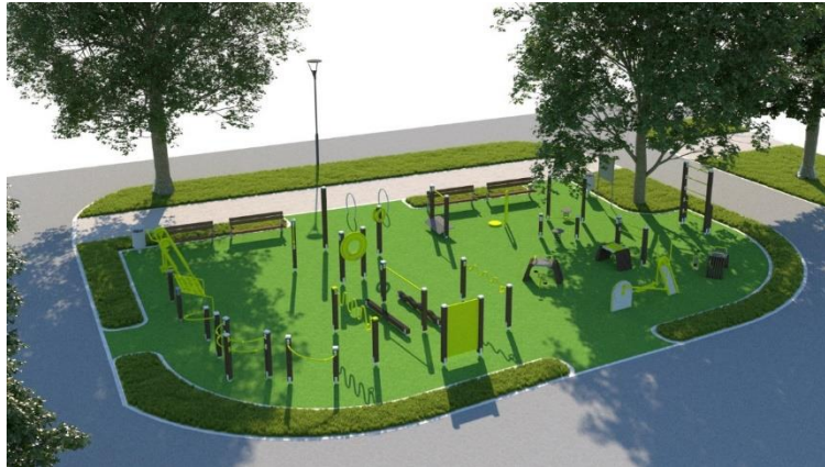
Foto: Brīvdabas vingrošanas laukuma vizualizācija