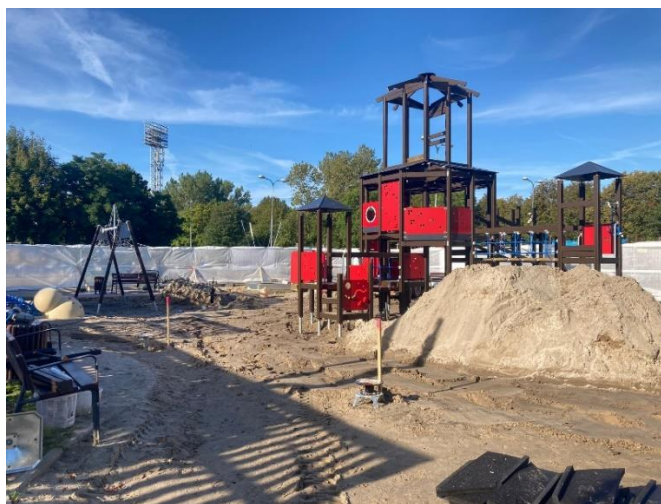
1.attēls. Būvlaukums 2023. gada 6. septembrī.

Liepājas Jūrmalas parka bērnu rotaļu laukumā turpinās jaunā rotaļu laukuma izbūves darbi. Iestājoties meteoroloģiski atbilstoši laikapstākļiem, rotaļu laukumā būvnieks SIA "Fixman" ir atsācis rotaļu laukuma izbūves darbus. Lai arī joprojām ir augsts gruntsūdens līmenis, ūdens tiek atsūkņēts, lai varētu veikt nepieciešamos darbus. Tiek turpināta laukuma pamatnes izbūve, kā arī rotaļu iekārtu montāžas darbi. Nu jau rotaļu laukums sāk iegūt savas aprises – tiek montēts galvenais laukuma elements rotaļu komplekss "Bāka", kā arī tiek uzstādītas citas rotaļu laukuma konstrukcijas.