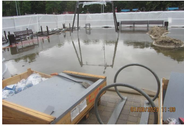
1.attēls. Būvlaukums 2023. gada 1. augustā.