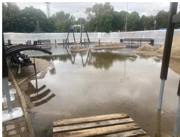
2.attēls. Būvlaukums 2023. gada 8. augustā