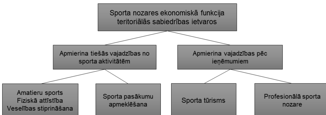
ATTĒLS 1.1. SPORTA NOZARES EKONOMISKĀS FUNKCIJAS TERITORIĀLĀS SABIEDRĪBAS IETVAROS STRUKTŪRSHĒMA

Sporta nozarei teritoriālās sabiedrības ietvaros ir vairākas funkcijas. Zemāk redzamais Attēls 1.1. palīdz izprast sporta nozares sociāli-ekonomisko nepieciešamību teritoriālās sabiedrības ietvaros: