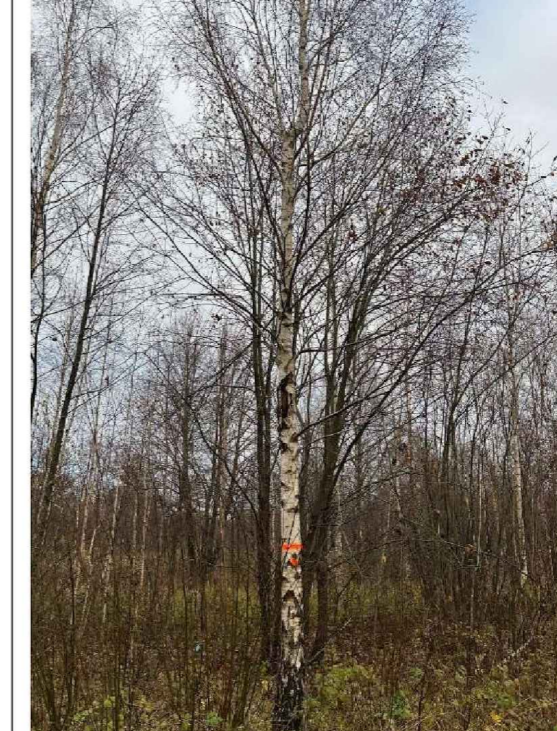
11. koks. Apkārtmērs 77cm, augstums 20m