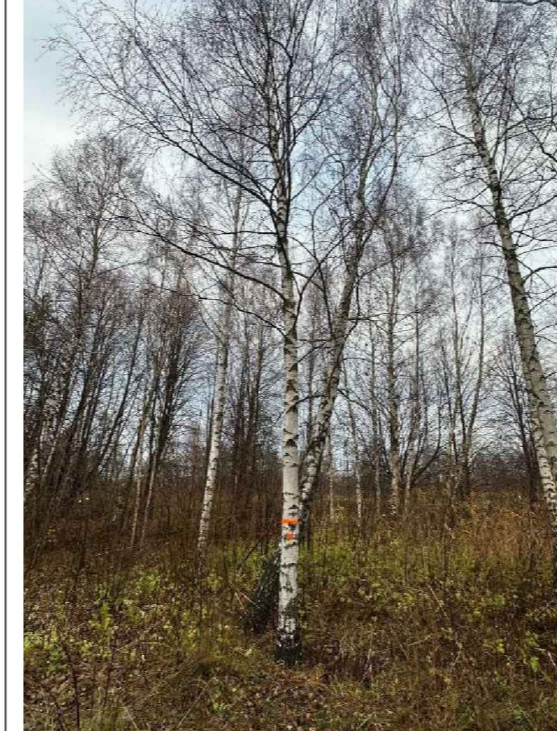
8. koks. Apkārtmērs 68cm, augstums 17m