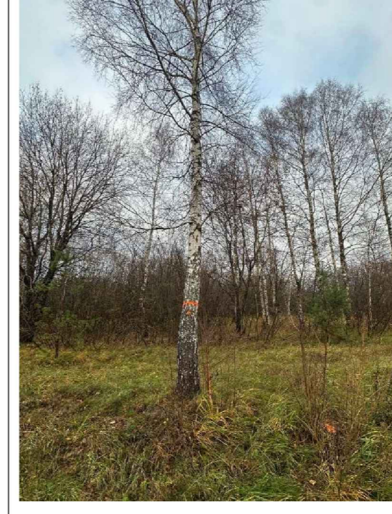
5. koks. Apkārtmērs 103cm, augstums 20m