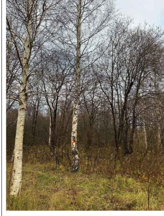
1. koks. Apkārtmērs 102cm, augstums 20m