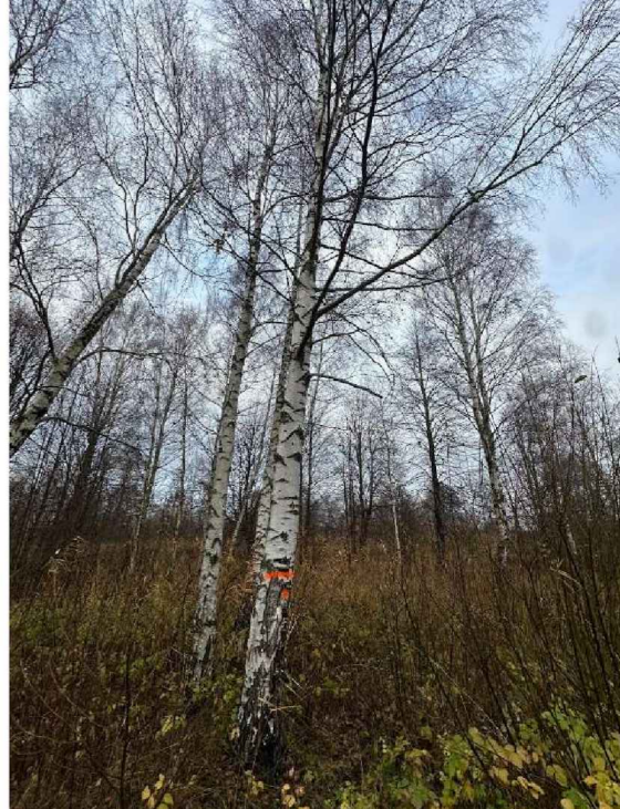
6. koks. Apkārtmērs 114cm, augstums 20m